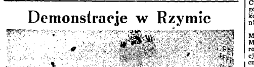
Demonstranci niosą transparenty z karykaturą premiera de Gasperi...