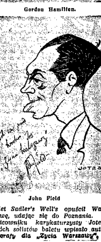
Bolet Sadler's Wells opuścił War-szawę, udając się do Poznania. W szkicowniku karykaturzysty Jotesa dwóch solistów baletu uwiaryli auto-orty dla "Zycia Warszawy".