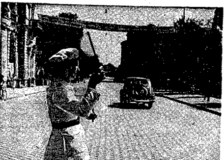
Po ulicach Sofii kursuje bardzo niewiele samochodów. W tle milicjanterze gwałtownie ruch na skrzyżowaniu dwóch głównych arterii miasta nie ma zbyt dużo do roboty.