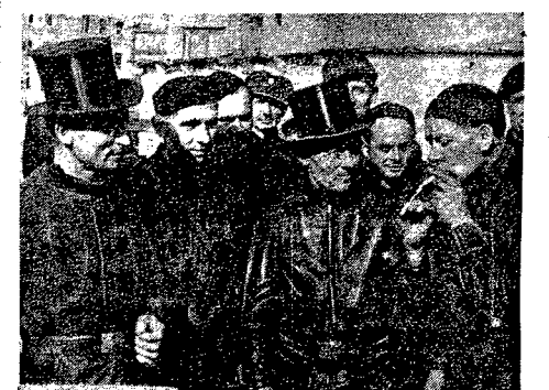
Do pracy przy odgruzowaniu Stolicy stanął wczoraj członkowie Cechu Kominiarzy z Dziadkowi. Płoseczna. Liburka, Żyrardowa i innych podwarszawskich miejscowości. Na zleżeniu: paronna izbowa kominiarzy przed gmachem Straży Ogólnej na pl. Unii. Kto wczoraj spotkał z raną i sympatyczną grupę kominiarską zainkasował kilkudziesiąt dni „szczęścia”. Udział kominiarzy przyniesie niewątpliwie również szczęście powstałej z gruzów Stolicy.