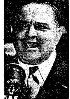
La Guardia przed mikrofonem

Chciałbym tu jedynie omówić po krótko postawę, jaką — w okresie powojennego zamętu i wytrwałej przeciw klamstwu prowadzonej kampanii pamięć La Guardia — zajmował Polaki w La Guardia.