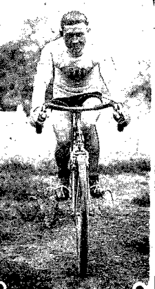
wielokrotny mistrz stowarzyszenia Wycieczek Kieleckiego i Częstochowy startował będzie w I Biegu Kolarskim Dookoła Polski Sp. Wyd. „Czytelnik“.

dworkrotnie startował Łazarczyk w Biegu do Morza - pierwszy raz w r. 1933 zajął szesnaste miejsce, następnym razem wycofał się na skutek kontuzji. Po wojnie zdobywa znowu mistrzostwo Częstochowy; bierze udział w wyścigu łódzkim o nazwę... CZŁONEK KOOPERACJI WOLNYCH JEST TO TYP, KTORZY ZCINI TWORZY SIĘMI SWOJE UMYŚLE, CHARAKTERU, SERCA I TO JEST OBYWATEL DEMOKRACJI.