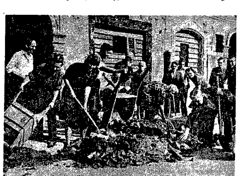
W piątek 19 bm. Związek Literatów Oddział w Warszawie zorganizował dzień odgruzowania na Starówce. Stało się ok. 20 osób spośród znanych warszawskich pisarzy.

Literaci pracowali przy odgruzowaniu podwórka kamienicy „Pod Murzynkiem” na Ryнку Starego Miasta.