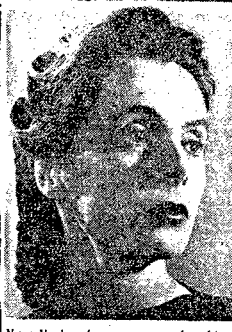
Na zdjęciu górnym: scena charakterystyczna w wykonaniu baletu "Sadlers Wells". Poniżej: twórczyni baletu Ninette de Valois (do artykułu niżej).

Centr. Zarz. Przem. Cukrowniczego przystąpił do budowy 23-cielich okowitarni: Gryfin i Kluczew w okolicy Szczecina. Zdolność produkcyjna nowych cukrowni po uruchomieniu tych dwóch obiektów wzrośnie do 1.600.000 t buraków. Jedną z tych fabryk weźmie udział w kampanii cukrowej roku 1948-49.