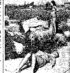
Dzieci powrotnie tall upalów Wisłi obokłała się jeszcze raz doskonałym miejscem wypoznyciu amatorów słownej kapieli...