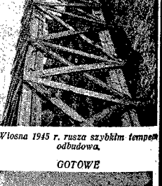
Wiosna 1945 r. rusza sztybnim tempem odbudowa.