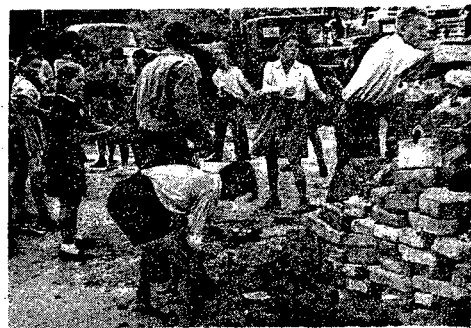
Zwawo przesuwają się cegły w młodych rękach — nikną sterty gruzów. Tak młodzież pracowała w ubiegłą niedzielę w Warszawie na Starówce.