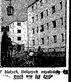
W blasku latających czerwonych mach wne lud żyje