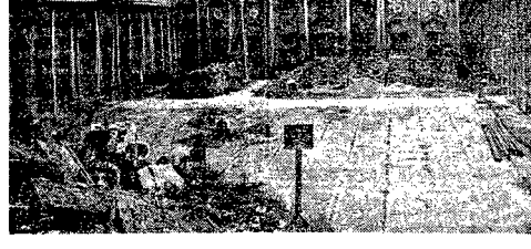
Wnętrze pałacu „Pod Blachą” w Warszawie, który jest odbudowywany.

Już w styczniu budynek oddany będzie do użytku. Obecnie prowadzone jest tam wmacnianie zewnętrznych ścian. (AS)