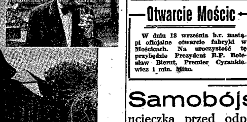
Płakata w Kudowie-Zdroju. Powyżej — „Jeczyczny głębszy”.

przeję. Bo koszty tego sporu skupiają się na kuracystach. Podobne domy kuracyjne w górach, posiadają sądownicy w Polanicy-Zdroju dla 120 osób, w Świerdowie-Zdroju 40 osób, dom wycoczynkowy w Szlarskiej Porębie oraz dom dla dzieci w Kamionkowie pod Świdnicą, gdzie przebywa latem 60 dzieci. Nadto Ministerstwo Sprawiedliwości subwydziałem domy wycoczynkowe prowadzone przez Zar. Zaw. Prac. Sądownych, które znajdują się w Wilie, Krywicy, Muszynie, Mielinie i — bołonie dla dzieci w Świdrze. Dzienna opłata za pobyt 85 zł, a dla członków rodziny 130 zł. Dotychczas w ciągu ostatnich kilku lat z domów wycoczynkowych nad