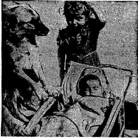
"Liszk" — wierny przyjaciel dzieci z m. Żelaznej i Leszno w Warszawie, pilnie swą malenką pani z czułością nie pozwalając się nikomu do niej zbliżyć.