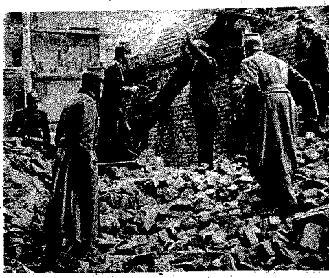
W braku innych „możliwości” — policja niemiecka poluje na własnych rodaków. Oto fragment oblawy w ruinach Berlina.