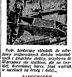
Zwrt, konieczny składnik do odbudowy zrujnowanych domów mieszkalnych i gmachów stolicy, przybywa do Warszawy nie statkiem, ale na wozach, drewnianym barce. Stąd weźmie, w łaczkach na brzeg i dalej.