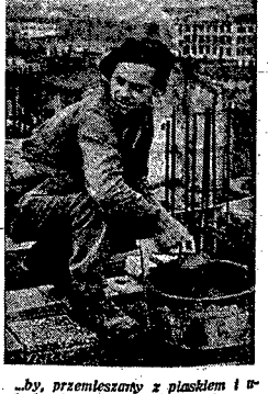
„by, przemierzony z piaskiem i trzechciowymi cementem i wodą, prowadzą robotną windą aż na szczyt wysokiej kamienicy, na betonowy dach. Od tam nie będzie irwał bezmyślnie na dno Wisły, ale skłamił się w jeden blok, obrócił miszłową siatkę deszczem i chlówem.