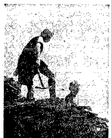
My też pomagamy w odbudowie Warszawy.