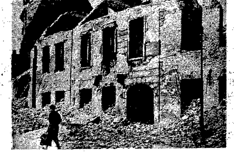
Dzisiaj przypada rocznica bohaterkiej śmierci członków sztabu AL. W dniu tym społeczeństwo stolicy żyłoby hoła poległym. Na mogile poległych na Krak. Przedmieściu w godzinach przedpołudniowych będą składać wieniec poszczególne organizacje polityczne i społeczne. W godzinach popołudniowych przybędą robotnicy i pracownicy. Na dziedzińcu grzyz kolumnicy przy ul. Freta 16, gdzie zginął sztabowiec AL.