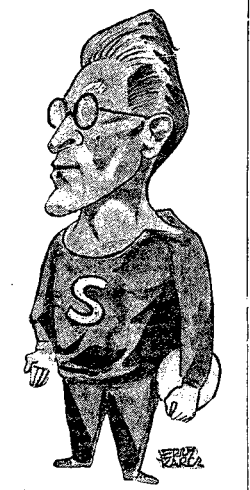
„As” polskiej lekkoatletyki Gierutło.