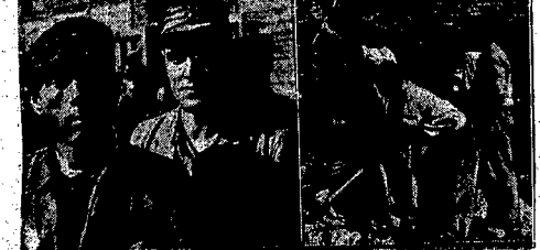
Jeńcy niemieccy uprawiają grun.

kw). Dwa razy gęściej jest ludność w Dolnym Śląsku (woj. wrocławskie), bo 63 ludzi na 1 km kw. i w woj. śląsko-dąbrowskim, gdzie sięga niemal poziomem przedwojennego (336 ludzi na 1 km kw.).