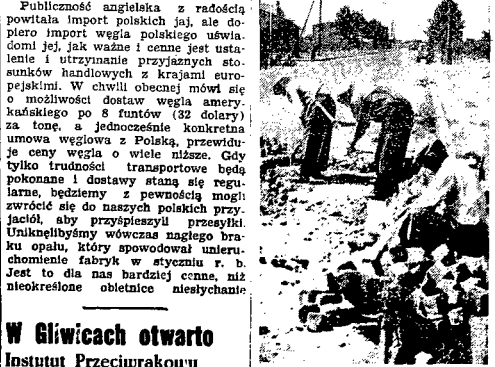
Uł. Wolska przecina szeroka wstega dzielnicę, która powoli dźwiga się ze zniszczenia.

Tędy przebiega w ciągu upałów dnia, czy w czasie słoty iyszące samochodów w kierunku na Łódź. Pozostł Bydgoszcz. Dlatego też szczególnie niebezpieczną nawpawiane są wszelkie nierówności tej nawierzchni.