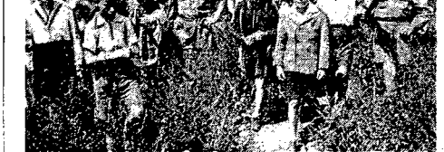
Na zdjęciu grupa dziewcząt i chłopów wraca z ostatniej warszawskiej przejazdki na Wale przed wyjazdem na wyprawę.

Nie trwał to jednak długo. W ciągu ostatnich dwóch tygodni stało się jasne, że z falami kredytami amerykańskimi będą związane pewne warunki polityczne, z których głównym wydaje się dominujący głos USA w sprawach Zagłębia Rührzy. I znowu rząd brytyjski stał się ostrożniejszy i bardziej ponury.