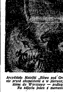
Arcydzieło Matejki „Bitwa pod Grunwaldem”, które ukryte było w Lublinie przed okupantami...