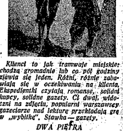
Klient to jak tramwaj miejski... czeka na klienta