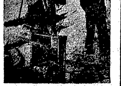
Nowe zwłazy będą kolowolotele stajemy myślenie być pozytywne. Przejazd pomocy, ten, widoczny na zdjęciu, „winda” wznosi na dwa piętra nowozwznowzonego domu przy ul. Nowy Świat.