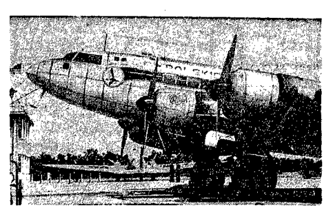
Najnowocześniejszy samolot P.L.L. „Lot” Languedoc, na którym kończą przeszkolenie polskie załogi. Za kilka dni 5 samolotów tego typu rozpocznie służbę w naszej komunikacji lotniczej.

Prace LOT-u idą obecnie w dwóch kierunkach: rozbudowa linii zagranicznych, obsługiwanych przez samoloty o dużym tonażu i krajowe, obsługiwanych przez aparaty mniejszego typu. ROZBUDOWA LINII KRAJOWYCH Realizując ten plan LOT uruchomił ostatnio jeszcze bardzo dogodny połączeń lotniczych pomiędzy ważnymi ośrodkami przemysłowymi i portowymi. Od dnia 1 b. m. czynna jest linia z Warszawy do Gdańska. Rozkład lotów jest tak dogodny, że można w ciągu dnia załatwić swe sprawy i wrócić z powrotem do Warszawy (Odot z W-wy godz. 8-9, przyjazd do Gdańska 9:30, odlot z Gdańska godz. 16-17, przyjazd do W-wy godz. 17:30). Poza tym uruchomiono dalsze linie: Gdańsk —