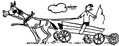
Rys. Nr. 6

W dniu dzisiejszym zamieszczamy zesty z kolei rysunek konkursowy. Rysunki konkursowe są ilustracją popularnych, znanych wszystkim powiedzonek.