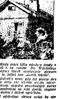
Kiedy przez kilka miesięcy leżały w 1943 r. na rampie Dw. Wileńskiego wysuszone kłody sępięcej, głowami na le. lubież tam „dławił” kłody.

Jeżeliż teraz, gdy już prawie dwa lata służyca wienle suwłm mieszkalcom, niejednemu przechodzącemu patrzy z zadręśnią na młde domki, skapanie w słońcu i zliceni ogródków.