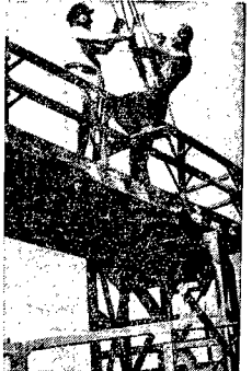
Tak „Jak ryba bez wody, a Mahomet bez brzoły”... tak tramwaj nie może się obyć bez przewoźnika sieci górnej.

Długo też przy przekładaniu torów na nowych trasach, jedynym środkiem na przeważnie się górna, która podobnie jak szyny na skrzyżowaniu, ma swoje rozjazdy. Tempo pracy i gorące silnice zmuszają obsługę, zajęta przeważaniem rozjazdów, do zdęcia koszu.