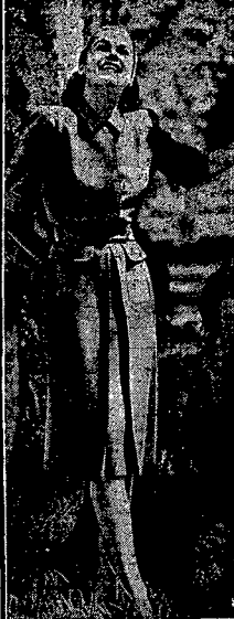
Teraz byłoby w niej za gorąco, ale w dniach chłodniejszych, sukienka ta, pracobienka i wędziana szara, aksamit, albo starszy kapci Ciotki, doskonale się nadaje na wszelkie okoliczności.

uwagi na to, że jest tu za ciepło. W jednej niewielkiej ani 30 łózek, w innej 24 — to się nie zgodza z wymaganiami zasad higieny, zwłaszcza w wyżywaniu dzieci. A przecież między innymi zarządcą, bowiem jedyną trzecią domu oraz objęty obszar ogrodu zajmują córka Buhiego, choć ma imy dam w Ato, Sarama Zakładu w celu uzyskania dla swych potrzeb całego gmachu idą nieistotnie opórku. Do tej pory odzwala się brak szeregów, teraz w czasie ep dem 12 kolumn — białych, są obserwowane i pomniejszenia na antybiotykiem.