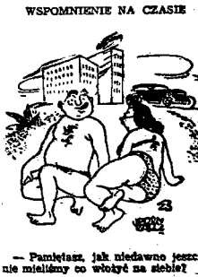
WSPOMNIENIE NA CZASIE

W naszym ciągu obrad plenarnego posiedzenia Rady Naczelnej Str. Demokracznego uchwalamy regulamin Rady Naczelnej i Centralnego Sądu