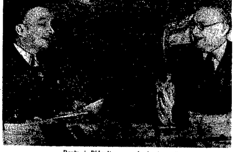
Bevin i Bidault w czasie konferencji.