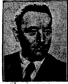
Prezydent Bolesław Bierut.

„Myśl, aby centralnym punktem tegorocznych uroczystości „Święta Morza” stał się odkryty przez Polskę prądkier, nielocustki Szczecińska na głębokość uzasadnienia.