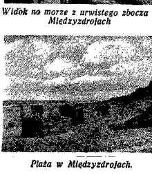
Widok na morze z urwistego zbocza w Miedzyszajochach

wartość przywozu wraża z roku na rok, to jednak deficyt handlowy będzie miał tendencję malejącą, gdyż tempo wzrostu wartości naszego eksportu będzie szybsze niż importu. W początkowym okresie Planu utrzymany będzie import deficytowych artykułów żywnościowych, który w dalszym okresie ulegnie ograniczeniu do pewnych ilości artykułów innych strali klimatycznych. Import artykułów gotowych będzie stopniowo zwiększony na rzecz naszego importu surowców i dóbr inwestycyjnych. Wzroście w czasie trwania Planu na stopniowo będzie wzrosł import inwestycyjnych i dużym procesie wytwórczym, których produkcja nie jest przewidziana w planie produkcji, a których import okaże się konieczny.