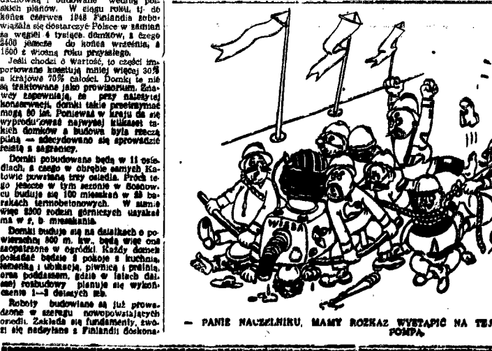
PANIE NACZELNIKU, MAMY ROZKAZ WYSTĄPIĆ NA TEJ SCENIE