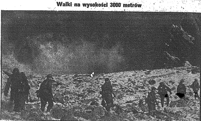
Chodzi o zdobycie przełęczy, łączącej na linii wiecznych śniegów. Niemiecka grupa bojowa została podzielona na poszczególne oddziały zwiadowcze, które okrążają przełęcz ze wszystkich stron.

Rząd bułgarski zwrócił się wczoraj z apelem do narodu, który mówi, że „dla wolności Bułgarii konieczne są dalsze ofiary i wysiłki”. Nie należy o tym zapominać, że rozstrzygają się obecnie na okres długiego czasu kwestie „miejsc”, jakie kraj ma zajmować.