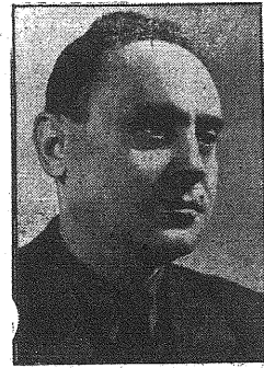
Pierwsze posiedzenie Rady Ministrów nowego rządu węgierskiego

BUDAPEST, 23 października. — Premier Szalassy, na pierwszym posiedzeniu Rady Ministrów nowego rządu węgierskiego, oświadczył, że zadaniem rządu jest totalne prowadzenie wojny przez Węgry u boku Niemiec, aż do zwycięskiego zakończenia oraz trwałe ugruntowanie sytuacji wewnętrzno-politycznej kraju. Plan, jaki ma być wykonany do dnia 1-go stycznia 1945 roku w porozumieniu z parlamentem powinien ustalić fundamenty prawno-państwowe, któreby określiły jasno treść i wzajemny stosunek czynników prawno-państwowych. Przed ścieżką rozwiązanie kwestii głowy państwa powinno być zatwierdzone do 4 listopada. Rząd wspólnie z parlamentem będzie prowadził sprawy państwowe i dzielił się odpowiedzialnością z obu izbami parlamentu za totalny sposób prowadzenia wojny.