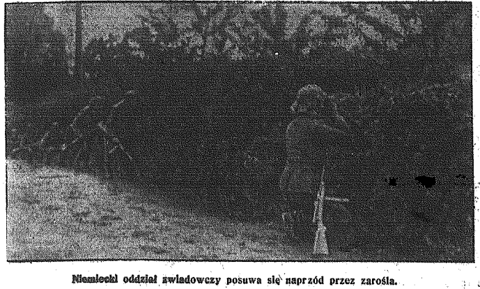
Niemiecki oddział wladowczy posuwa się naprzód przez zarośla.