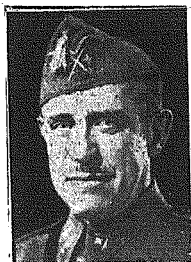
Hiszpański minister spraw zagranicznych hr. Jordana zmarł nagle 3 sierpnia r. b.

Niemcy posiadają także wielką ilość łodzi, które sprawiają nieustanny kłopot transportowcom alianckim w Kanale La Manche. Skutkiem błyskawicznej wprost szybkości, z jaką operują, nie można nieraz przeszkodzić im celnym wystrzałem torped. Również wiadomo, że udało im się zatopić kilka alianckich statków.