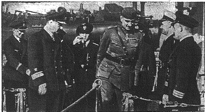
Gen. Valve, szef marynarki fińskiej został odznaczony przez Führera Niemiecłkim Złotym Krzyżem.