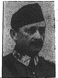
Marszałek Mannerheim został wybrany na prezydenta Finlandii.

Niemieckie i węgierskie siły obrony przeciwlotniczej zestrzeliły 28 samolotów nieprzyjacielskich.