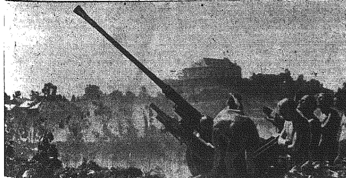
Niemiecka armata przeciwlotnicza w akcji na północy frontu wschodniego

Z okazji rocznicy proklamowania niezawisłości Burmy Führer wystosował na ręce prezydenta państwa Burmy dra Ba Maw depeszę gratulacyjną.