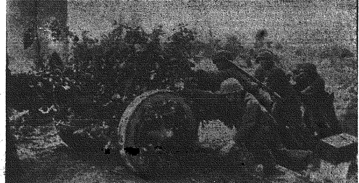
Dobrze zamaskowane niemieckie działa przeciwpancerne na froncie