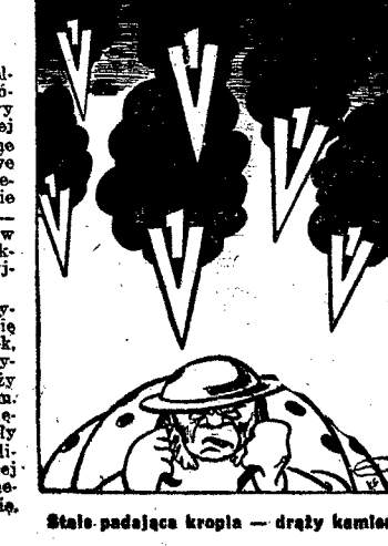
Stale padająca kropla — drąży kamień

miecy odrzucili wszystkie ataki angielskie. Poszczególne czołgi angielskie, którym udało się poprzez niemieckie rowy strzeleckie dotrzeć na tyły niemieckiej głównej linii bojowej, zostały zmuszone do walki przez formacje przeciwczołgowe jeszcze przed pozycjami niemieckiej artylerii. W ciągu wtorku popołudnia niszczenie tych czołgów brytyjskich było w toku. — Według niezupełnych jeszcze raportów, w ciągu wtorku zlikwidowano w tym punkcie frontu inwazyjnego 37 czołgów brytyjskich. Również na odcinku frontowym amerykańskiej armii inwazyjnej wywazyły się we wtorek ożywione walki, które jednak, pomimo poważnych ilości materiału, użytego do boju przez Amerykanów, należy określić jako akcje, o „małym lokatywnym”. Ataki wojsk amerykańskich, po osiągnięciu nikłych zysków terenowych, załamały się jeszcze przed niemieckimi głównymi liniami bojowymi. W ogniu automatycznej broni niemieckiej jednostki piechoty amerykańskiej poniosły ponownie wysokie, krwawe straty.