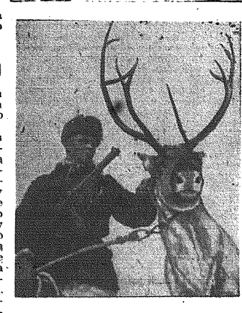
W Japonii używa się reniferów jako zwierząt przelagowych w służbie walczących tam oddziałów niemieckich.