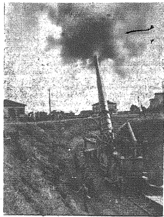
Komunikaty Naczelnej Komendy Niemieckich Sił Zbrojnych wspominają często o skutecznym zastosowaniu dział dalekonośnych przy ostrzeżeniu anglo-amerykańskiej floty desantowej na przyczółku Nettuno. — Zdjęcie przedstawia jedno z takich dział podczas akcji