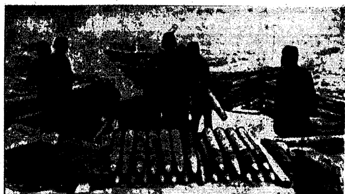
Bateria artylerii przeciwlotniczej skierowała luty swych dział w głąb lada i osłoniła swoje pozycje sowieckie na brzoze rzeki Narwy.