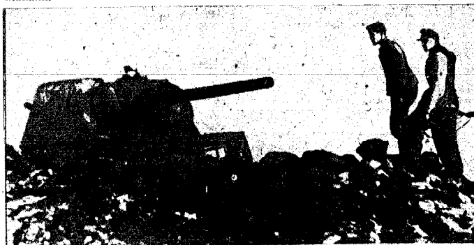
czki czołg sowieckiej w otwartym w terenie na pozycji czerwonej armii i tylko tego wycia pancerna wznosiła się nad frontem. Cofnięty granatnik niemiecki, wystrzelony z „Tygrysa” kotos bolszewicki został zlikwidowany.

W Cairze rozszalały się wiadomości, że Syria, Saud Arabia i Jemen włożyły prestat do rządu Stanów Zjednoczonych przeciwko wywieśniam sygnalizywnym wysiedlającym w Waszyngtonie na prezydentura wydziału Kongresu, a podobna gratyja wyszła już także z Egiptu i Iraku.