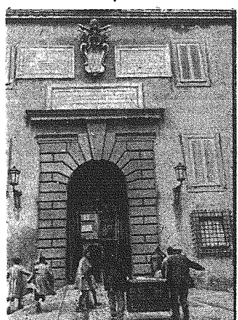
Zdjęcie przedstawia fragment pałacu w Castel Gandolfo, który padło ofiarą terrorystycznego nalotu Anglo-Amerykanów.