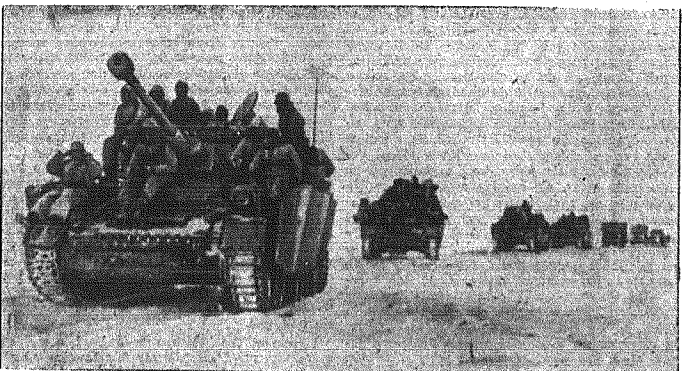
Czołgi niemieckie w drodze na front