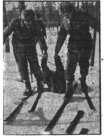
Po długim pościgu na nartach udało się żołnierzom na fińskim upolować niedźwiedzia, którego następnie w tryumfie transportują do swoich obozów.

bezwzględnej i mocnej decyzji, na drugi plan wszystko, co nie jest niezbędne i w ten sposób zapewnił sobie zawsze swobodę działania i operacji. Kategoryczny rozkaz, wydany przez Führera, aby „obecna wojna za wszelką cenę rozwiązać zwycięsko”, nakłada obowiązek na każdego mężczyznę i każdą kobietę w całym narodzie niemieckim. Naród niemiecki, jak podkreśla autor artykułu, odważnie i dzielnie zda egzamin także i w tym roku.