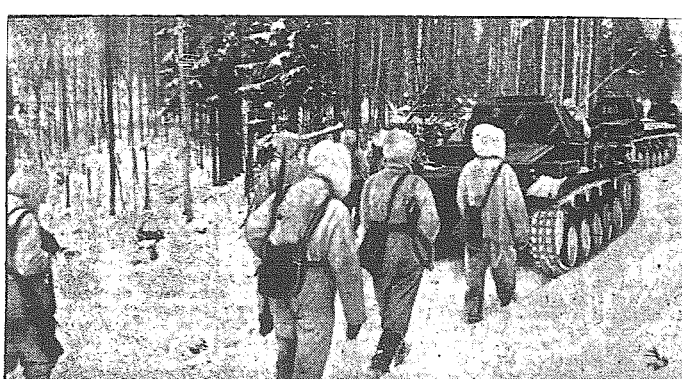
Pod osłoną czołgów piechota fińska maszeruje przeciw bolszewikom przez teren lasisty.