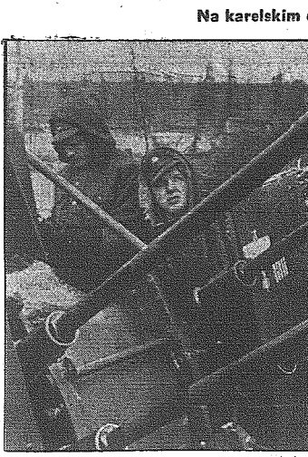
Poczerwone armaty przeciwlotnicze strzeżę strefy powietrznej nad pozycjami niemieckimi. Pięć kresek na tarczy ochromel wskazuje, że z dział tego zestrzelono już takąż liczbę maszyn sowieckich

Z GŁÓWNEJ KWATERY FUHRERA, 16 grudnia. Naczelna Komenda Niemieckich Sił Zbrojnych komunikuje w dniu 15 grudnia: Na odcinku Kirowogrodu odparto krwawe ataki bolszewików, prowadzone na szerokim froncie. Niemieckie formacje pancerne, skutecznie wspierane przez lotnictwo, przeszły do przeciwaataków, złamyli opór nieprzyjaciela i wyparły go z kilku punktów włamania. Odzyskano przy tym utraconą przejściowo, ważną miejscowość, na północ od Kirowogrodu.