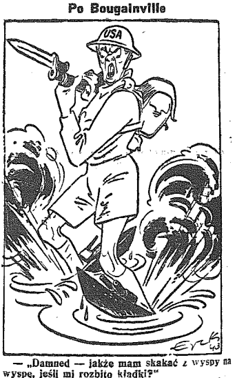
— „Damned — jakże mam skakać z wyspy na wyspę, jeśli mi rozbito kładki!”