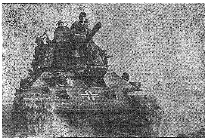
Biorze udział w walkach obronnych w rejonie Dniepru. Zdjęcie przedstawia ochotników jadących na czołgu do akcji bojowej.