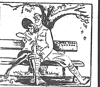
„Dzwonił kochanie — wszystko co my, Amerykanie czynimy, robimy zawsze w imię wolności, sprawidliwości, kultury oraz moralności.”