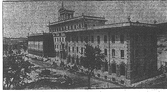
Pałac gubernatora Miasta Watykińskiego przed nalotem terrorystycznym Angloamerykanów.

PARYŻ, 13 listopada. — Tymczasowo obradujące zgromadzenie emigrantów francuskich w Algierze przystąpiło do utworzenia 8-miu wielkich komisji. Bezpośrednio potem wywiała się dyskusja nad formalną czystką w wszystkich dziedzinach. Były żydowski poseł do parlamentu Bloch zażądał kary śmierci dla b. francuskiego ministra spraw wewnętrznych Pujou, który przeszedł do emigrantów i od pewnego czasu znajduje się w więzieniu.