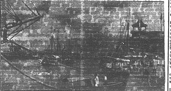
Widok Manila — stołczy Filipin