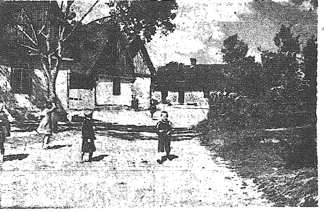
Już niedługo nie będzie można biegać na bosaka!