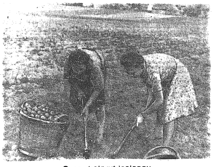
Szary koloryt jesienny