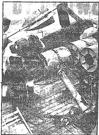
Starannie czuwa podoficer nad montowaniem bomby wodnej