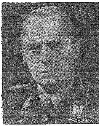
minister spraw zagranicznych Trzeciej Rzeszy obchodził dziś 50-tą rocznicę urodzin.

Ziemia Katynia, całe terytorium b. Polski zabezpieczone są przez Niemcy. Zabezpieczone przeciwko powtórzeniu się tych potwornych wypadków, do których rząd sowiecki obecnie się przyznaje, a które Wielka Brytania i Stany Zjednoczone w milczeniu akceptują. Polscy jeńcy wojenni, którzy dostali się w ręce niemieckie — żyją. Ich losom nie jest jednak zbiorowo groźb, ich zadaniem jest praca nad dziełem nowej i lepszej Europy. Podlegają oni kierownictwu, które przyczyni się do umocnienia, aby małe narody na kontynencie nie stanęły pod niewłaściwej strzechy i by w związku z tym nie zostały wycięzione. Zagadnienia polskie, rozwiązywane na sposób moskiewski i traktowane przez Wielką Brytanię i Stany Zjednoczone, jest nie-dwuznacznym dowodem nieudolności mocarstw, które nie są w stanie wyprowadzić nowego i lepszego świata ze zglizku obecnej wojny. Sa dowodem ich nieudolności, jeśli chodzi o przydzielenie narodom zachodnim kierujących roli dziejowej. Zadanie to mogą rozwiązać jedynie mocarstwa nowego ładu europejskiego i to w duchu polityki, która — w miejsce zasady wytipienia przyjęła zasadę współpracy.