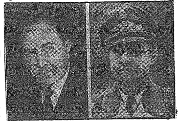
H. H. Dieckhoff, b. ambasador w Waszyngtonie, mianowany ambasaderem w Madrycie (z lewej strony). Dr v. Steengracht — mianowany sekretarzem stanu w Min. Spraw Zagranicznych (z prawej strony).