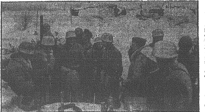
Oddział szperaczy przed wyruszeniem do akcji