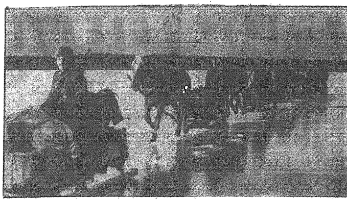
Na północno-wschodnim odcinku frontu gładko posuwają się szare, z zaopatrzeniem dla walczących oddziałów.