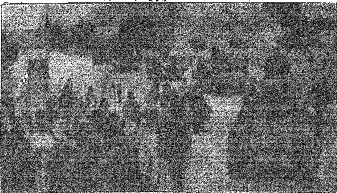
Po zajęciu Gafsa: włoskie kolumny zmotywowane wtracają do miasta.