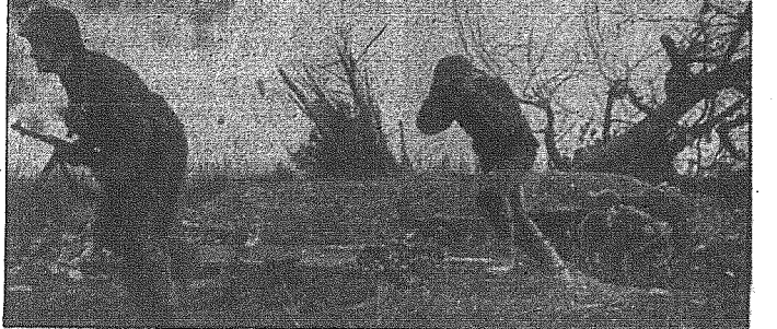
Na froncie wschodnim: Alarum