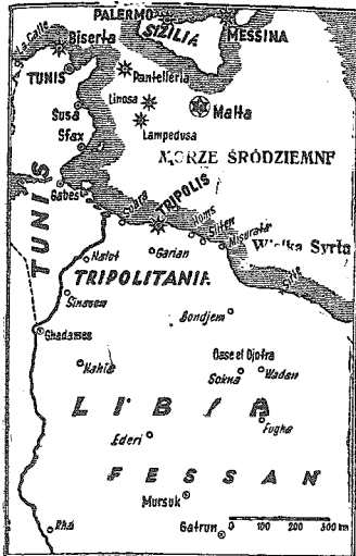
w Afryce Północnej