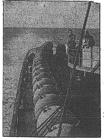
Rumuńskie stawiacze mln na Morzu Czarnym