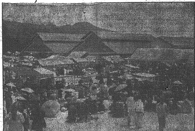
Jaję w Kula Lumpur na półwyspie Malajskim