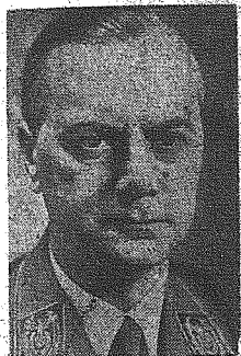
Minister A. Rosenberg

Prace aparatu administracyjnego rozpoczęte / Naczelnym hasłem: Przywrócenie ładu, spokoju i porządku / Organizatorzy niemieccy wobec nowych i bardzo dużych zadań