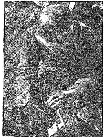
Bolszewicy minami usiłują tarasować drogę niemieckiemu pochodu wojennego. Dzięki skomplikowanemu przeszkuczeniu terenu przed saperów, Niemcy sprawnie usuwają je przeskody. Dotychczas wydobyto już dziesiątki tysięcy min na froncie.

Berlin, 31 października. — Wiadomości, jakie otrzymuje zagranica z Moskwy są w formie bądź to pigulek uspokajających, bądź też brzmia bardzo alarmujących. Ostatnio przeniknęły informacje, że tramwaje i kolej podziemna w dalszym ciągu są nadal czynne. Ale równocześnie donoszą o tym, jakoby ludność cywilna została wciągnięta do śpiesznego robot, celam improwizowania fortyfikacji wokół miasta. Brytyjska służba prasowa donosi, że walki powietrzne nad miastem rozgrywa się coraz częściej, powodując dotkliwe straty oraz że front bojowy zbliża się coraz bardziej pod bramę miasta. Jak się w rzeczywistości sprawa przedstawia, możemy sobie wyobrazić, bowiem nie jest tajemnicą, że Moskwa liczy kilka milionów mieszkańców. Zarówno na terenie miasta, jak i w