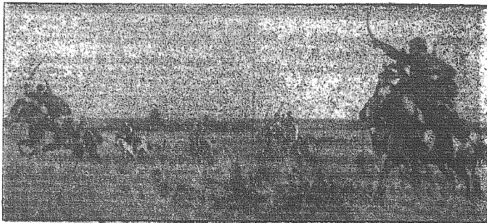
Tak pędzi Budynny swych koszałków w ogień — W amerykańskich gazetach polawity się takie zdjęcia, mające stanowić apoteozę bolszewików...