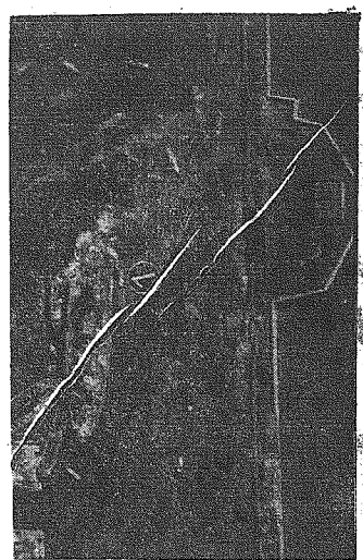
Zdjęcie lotnicze portu w Kronsztadzie (port leningradzki). — Wyraźnie rozpoznac można znaczący strażak, zbombardowany przez lotnictwo niemieckie okręt wojenny.