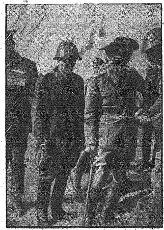
Marszałek Antonescu na inspekcji stojących w polu oddziałów rumuńskich