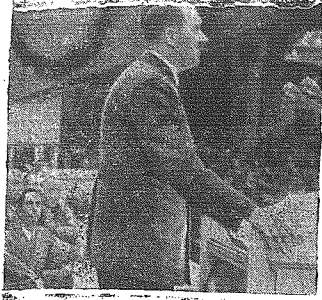
Przemówienie Kanclerza Adolfa Hitlera w Pałacu Sportowym w Berlinie

Ostatnie przemówienie Kanclerza Hitlera było nie tylko najbardziej doniosłym wydarzeniem ostatnich dni, ale przez militarne, polityczne i społeczne konsekwencje stało się najbardziej doniosłym wydarzeniem historycznym współczesnego okresu historii. Już w kilkanaście godzin po zapowiedzi Wodza Trzeciej Rzeszy, że „sa w toku nowe gigantyczne operacje”, nadzwyczajne doniesienia Naczelnej Komendy Armii Niemieckiej przyniosły największe w obecnej wojnie dezertry, zapadłe po zwycięstwach Niemiec na froncie wschodnim. W kleszczach niemieckich armij znalazł się trzon kwiatu czerwonej armii — czerwone dywizje marszałka Tymoszenki.