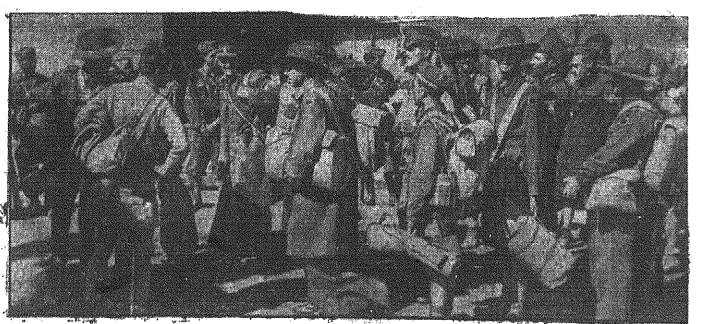
Jedzy-Analox pod Tobrukiem