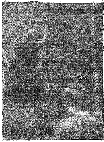
Na lewo: Niemiecki ciężki krążownik płynie na pełnym morzu. Zauważono w pobliżu nieprzyjacielski statek! - Na maszt widać flagę wojenną Rzeczy. - Na prawo: Po zatrzymaniu okrętu nieprzyjacielskiego, Pasażerowie opuszczają jego pokład. - Za chwilę zostanie zatopiony.